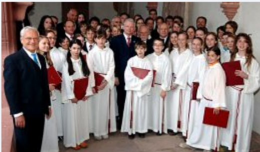
Kloster Eberbach (mit Michael Gorbatschow und Ministerpräsident Roland Koch)