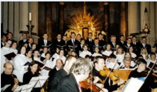
Weihnachtsoratorium von J. S. Bach